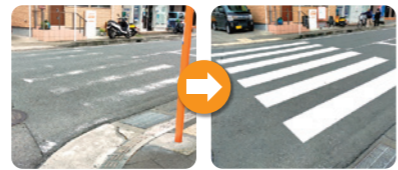
横断歩道の白線の修繕 (岡田地区)。