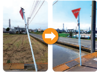
標識の修繕 (一之宮8丁目)。