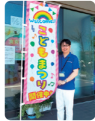
準備から運営まで多くの方のご協力により、子供達は大いに楽しみました!