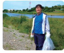
相模川美化キャンペーンに参加。