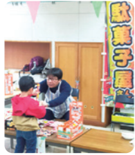
公民館祭で一之宮東自治会の活動に参加。