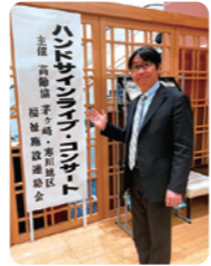
神奈川高齢協主催の手話&ダンス、ハンドサインライブコンサートに参加。