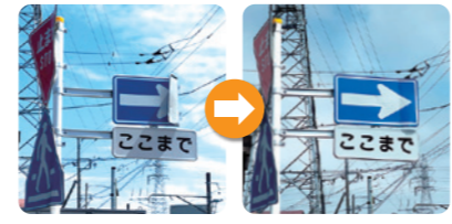
標識の修繕 (岡田地区)。