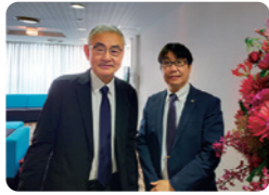
認知症治療の第一人者である、繁田雅弘東京慈恵会医科大学主任教授の最終講義を受講。