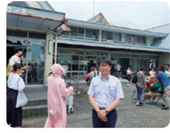
福祉活動センター祭。催し物を鑑賞し、福祉現場のご意見を聞かせていただきました。

これまでに約 320 件の町民皆様からのご要望・ご意見に対応させていただきました!