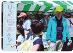
環境フェスにエコネットの皆さんと参加。