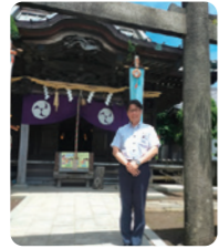
一之宮八幡大神の虫送祭の神事に参列。