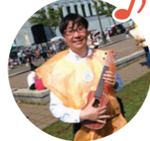
ウクレレひろばの皆さんと「守られし里 縄文フェスティバル」に参加。