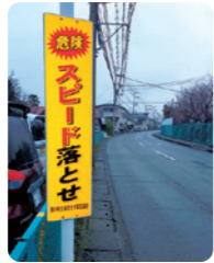
スピードを出す車両が多く通行するとご相談をいただき、担当課が2ヶ所に啓発看板を設置 (一之宮6丁目)。