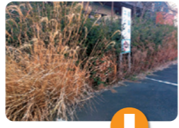
草の管理についてご相談をいただきました (寒川駅南口バスロータリー)。