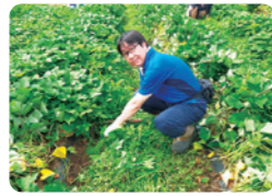
小学生さつまいも収穫前の草むしり。