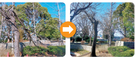
台風後の木の安全管理へのご意見をいただき、担当課に対応いただきました (一之宮公園)。