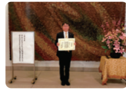
青少年活動推進者として県より表彰されました。