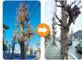
木の伐採 (一之宮3丁目産業道路沿い)。